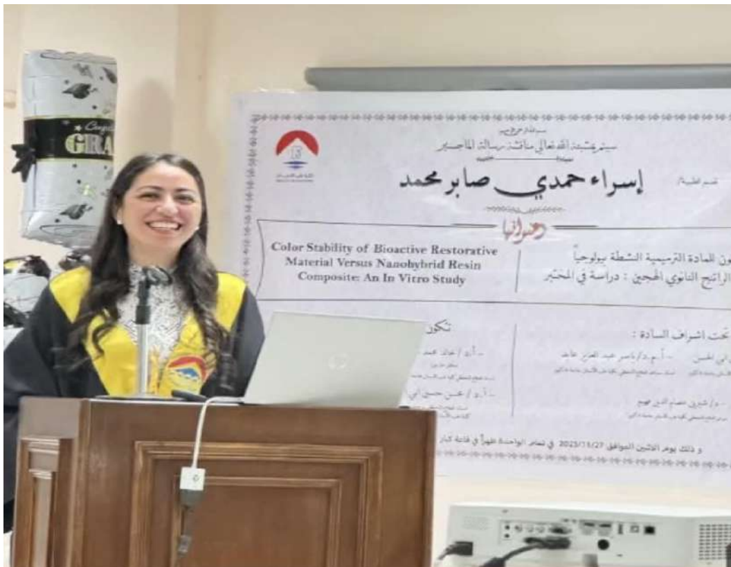
تقرير عن مناقشة رسالة الماجستير