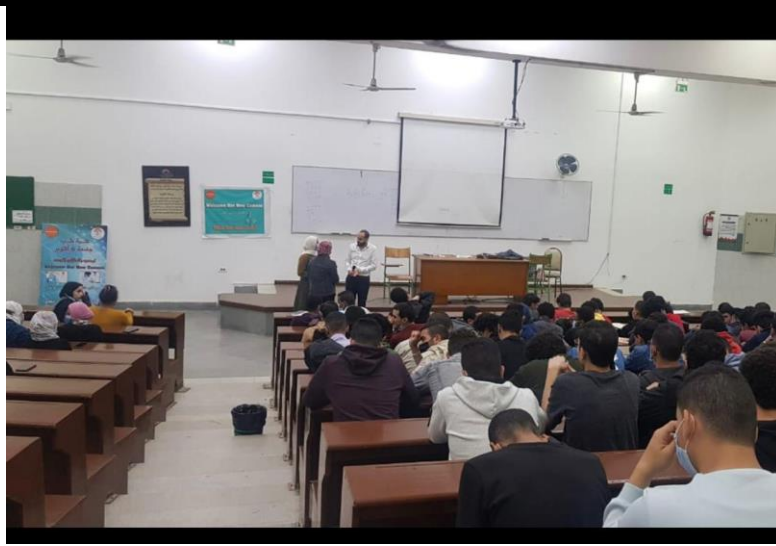
عقد ندوة عن التسوق الإلكتروني والتجارة الإلكترونية