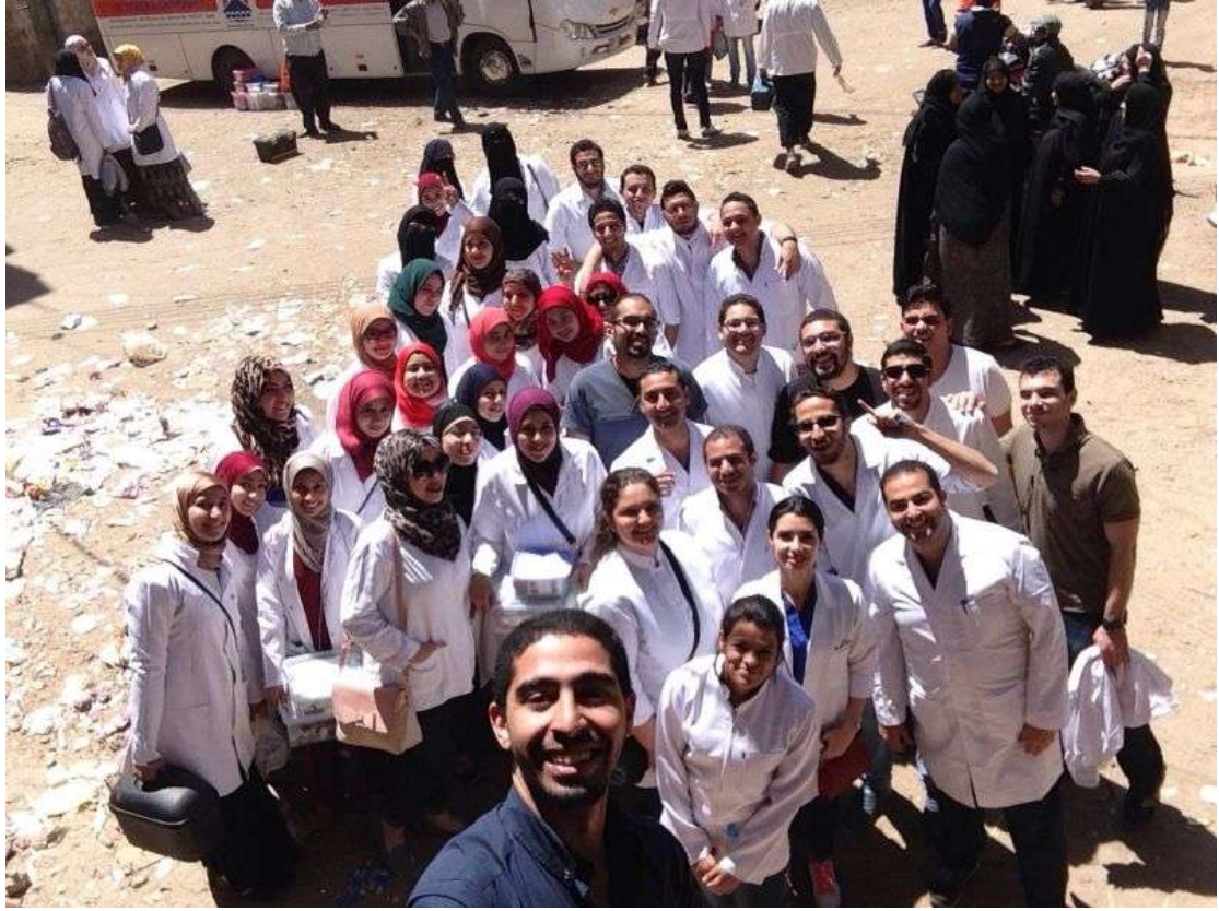
اليوم الرياضى يوم الأحد ٢٦/٤/٢٠١٥