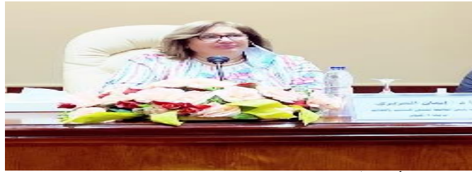
الأستاذة الدكتورة / ايمان العزيمي نائب رئيس الجامعة لشئون التعليم والطلاب