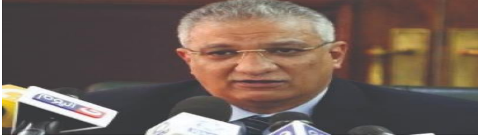
الاستاذ الدكتور / احمد زكى بدر رئيس مجلس امناء جامعة 6 أكتوبر