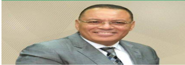
الاستاذ الدكتور / ممدوح مصطفى غراب رئيس جامعة 6 أكتوبر