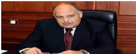
الأستاذ الدكتور / ياسر الدكرورى نائب رئيس الجامعة للدراسات العليا والبحوث