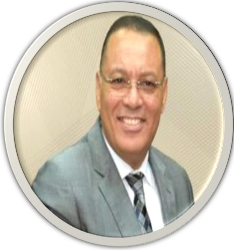
أ.د. / ممدوح مصطفى غراب رئيس جامعة 6 أكتوبر