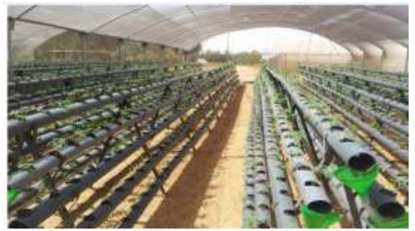
أنتاج الطماطم في النظام الغمرى المكثف