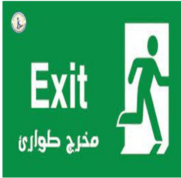
7- التوجه إلى مخرج الطوارئ