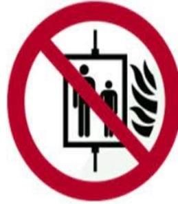
5- عدم استعمال المصاعد