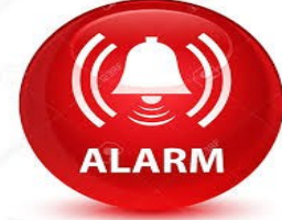
1- تشغيل صافرة الإنذار