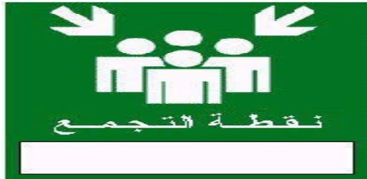
9- الانتظار في نقطة التجمع