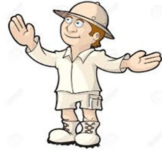
4- الالتزام بتوجيهات فريق الأزمات