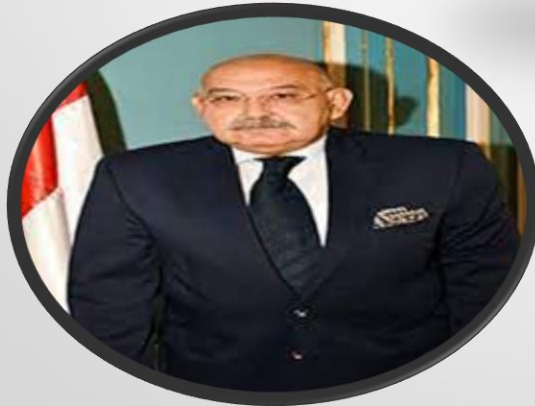
نائب رئيس الجامعة لشئون خدمة المجتمع وتنمية البيئة