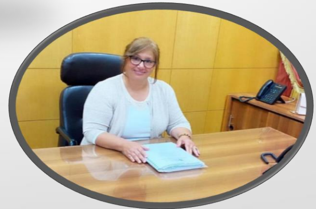
نائب رئيس الجامعة لشئون التعليم والطلاب

وقائم بعمل نائب رئيس الجامعة للدراسات العليا والبحوث